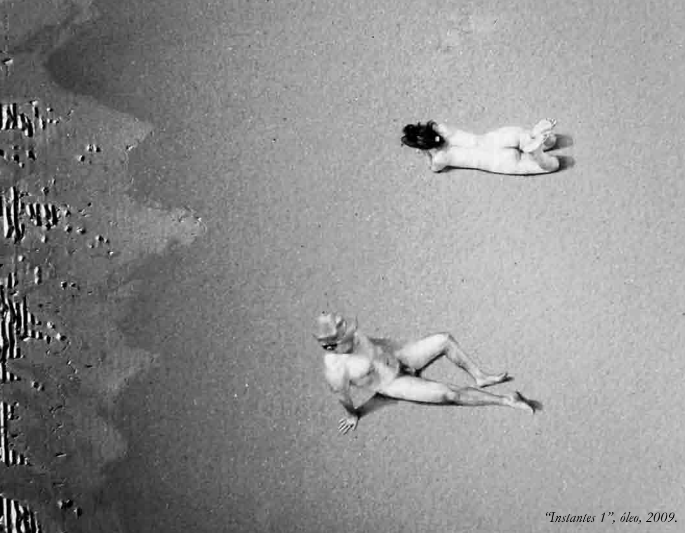
“Instantes 1”, óleo, 2009.

Actualmente vivimos en una época de grandes transformaciones donde nuestras formas de producir, consumir, gestionar y pensar transitan en los múltiples lugares que originan las relaciones de poder. Habitamos en un mundo globalizado que, siguiendo a Borja y Castells (1997), es asimétricamente interdependiente. En él las nuevas tecnologías y el desarrollo económico constituyen la infraestructura indispensable para una sociedad global.