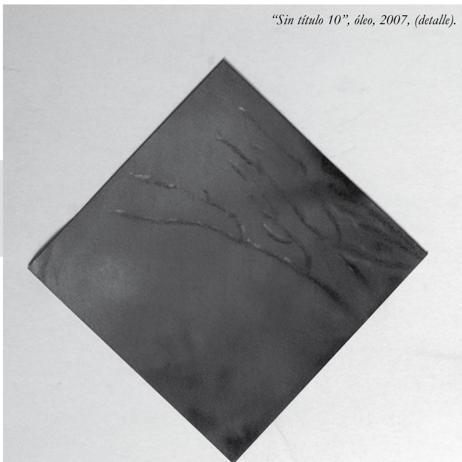
"Sin título 10", óleo, 2007, (detalle).

Sin embargo, el espinoso aspecto de la competitividad no podrá darse mientras la educación perdure en la senda de los tecnócratas y las asimetrías del sistema capitalista no sean resueltas; por esto es que aprobar el amoldamiento de la escuela al mercado es condenarnos a la exclusión. En este sentido, la sociedad mundial y los Estados deben oponerse a la mercantilización de la educación, puesto que la