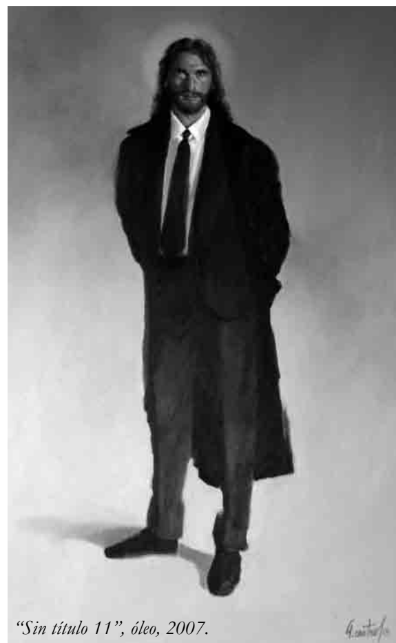
"Sin título 11", óleo, 2007.