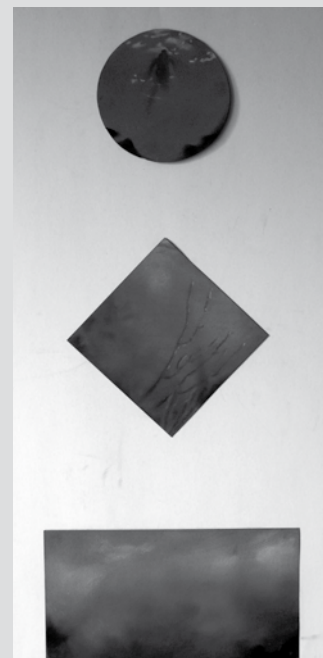
"Sin título 10", óleo, 2007.

En este panorama, la producción del saber, por ejemplo en el campo médico y especialmente en la genética, evidencia como el hombre se convierte paulatinamente en una especie de mercancía fragmentada. Para ilustrar mejor es preciso recordar cómo el hombre alejado de la lógica mecánica de las sociedades industriales se inserta al régimen digital en el que se exhibe como sistema de procesamiento de datos. De este modo, "lanzando a la nueva cadencia de la tecnociencia el cuerpo humano parece haber perdido su definición clásica y su solidez ontológica en esta era digital y se vuelve permeable, proyectable y programable" (Sibilia, 2005, p. 50).